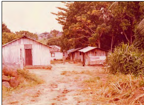
Veel huizen waren van planken gemaakt.

Behalve het uitdovende vuur en het zwakke schijnsel van een verre straatlantaarn had ik geen ander licht in de kamer en kon niet goed zien waar de slang zich naar toe bewoog, terwijl ik terecht vermoedde dat de slang mij wel kon zien en in de aanval ging vanwege een verschroeide rug. Op de eettafel gesprongen en een van de eettafelstoelen gepakt om mee te slaan, het enigste wat binnen mijn bereik was. Het was blijkbaar een grote Mamba, want in het onrustige schijnsel van het vuur stond hij meer dan twee en een halve voet omhoog. Krash!, daar ging de eerste eetkamerstoel, met de resterend rugleuning zou ik te dichtbij het beest komen dus die maar gebruikt als projectiel en een andere stoel gepakt. Na een paar bordes, die ik ook als projectielen gebruikte, en drie stoelen kapot geslagen te hebben was hij plots verdwenen. Bij het steeds zwakker wordende schijnsel van het vuur, en balancerend op de tafel met behulp van de laatste stoelpoot het licht aangekregen. De slang was weg, blijkbaar weer via de royale kier onder de carpoort deur het bos in. Sindsdien altijd maar een zaklamp bij je hebben en eerst het licht aandoen, en ook de kieren onder de deur dichtzetten. Zo leer je elke keer wat nieuws.