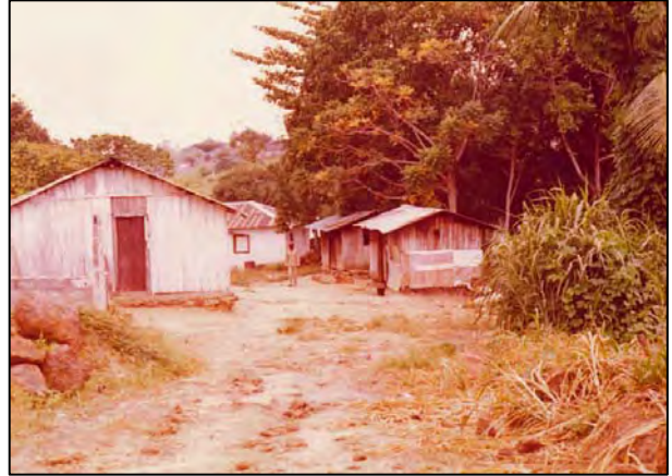
Veel huizen waren van planken gemaakt.

Behalve het uitdovende vuur en het zwakke schijnsel van een verre straatlantaarn had ik geen ander licht in de kamer en kon niet goed zien waar de slang zich naar toe bewoog, terwijl ik terecht vermoedde dat de slang mij wel kon zien en in de aanval ging vanwege een verschroeide rug. Op de eettafel gesprongen en een van de eettafelstoelen gepakt om mee te slaan, het enigste wat binnen mijn bereik was. Het was blijkbaar een grote Mamba, want in het onrustige schijnsel van het vuur stond hij meer dan twee en een halve voet omhoog. Krash!, daar ging de eerste eetkamerstoel, met de resterend rugleuning zou ik te dichtbij het beest komen dus die maar gebruikt als projectiel en een andere stoel gepakt. Na een paar bordes, die ik ook als projectielen gebruikte, en drie stoelen kapot geslagen te hebben was hij plots verdwenen. Bij het steeds zwakker wordende schijnsel van het vuur, en balancerend op de tafel met behulp van de laatste stoelpoot het licht aangekregen. De slang was weg, blijkbaar weer via de royale kier onder de carpoort deur het bos in. Sindsdien altijd maar een zaklamp bij je hebben en eerst het licht aandoen, en ook de kieren onder de deur dichtzetten. Zo leer je elke keer wat nieuws.