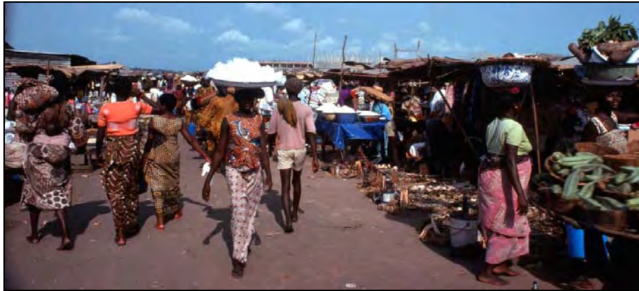
Markt in de snel groeiende urbanisaties van west Afrika.

Uiteindelijk werd het een hoge muur langs de hele weg, want alle andere plannen duurde te lang of waren niet afdoende of te kostbaar. Bomen kon je dan nog altijd later voor die muur planten, maar een hoge muur loste ook meteen het probleem van de overstekende voetgangers op. De bomen zijn er bij mijn weten nooit gekomen, en de bevolking had al snel en paar gaten in de muur om toch te kunnen oversteken.