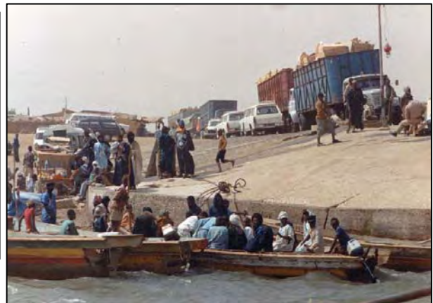
Senegal rivier overstek naar Mauritanië.

Het hele land was een grote zandwoestijn met acacia struikjes, en de bevolking woonde grotendeels in tenten van geitenhaar. Het voordeel is dat deze 's nachts snel afkoelen, maar in de winter kan het er zelfs vriezen.