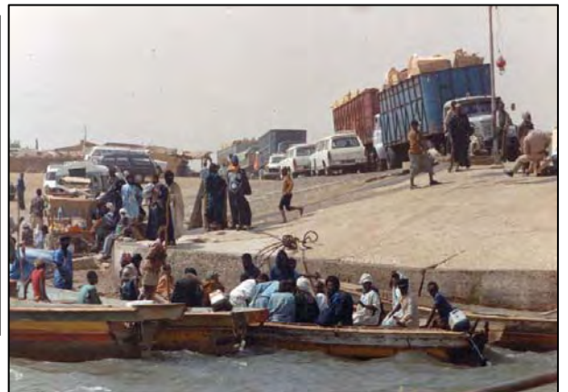
Senegal rivier overstek naar Mauritanië.

Het hele land was een grote zandwoestijn met acacia struikjes, en de bevolking woonde grotendeels in tenten van geitenhaar. Het voordeel is dat deze 's nachts snel afkoelen, maar in de winter kan het er zelfs vriezen.