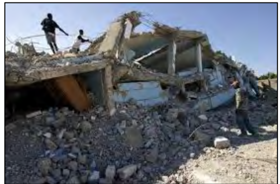
12 januari 2010 aardbeving in Haïti

De 7.2 Richter schaal aardbeving van 12 januari 2010 in Haïti leidde tot de dood van meer dan 50,000 van de stadsbevolking, hoofdzakelijk de armere bevolking die in slecht gebouwde woningen zaten. De vraag waarom dat kon gebeuren is altijd een combinatie van armoede, geen behoorlijke informatie over beter bouwen, geen overheidsplanning of toezicht, geen deugdelijke regionale planning en geen financieringsmogelijkheden voor duurzame woningen. Een aardbeving van 7 op de schaal van Richter zal in Quito vandaag de dag veel meer slachtoffers maken, want de slechte gebouwen zijn er nog steeds.