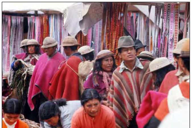
Riobamba de weekmarkt, centrum in het Altiplano gebied.