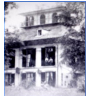
Archieffoto van het oude huis, in 1986 gesloopt.