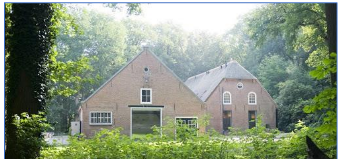
Internetfoto van de boerderij in 2019.

Een stichting De Hoorneboeg had het beheer, en er werd een afdeling van de YMCA en een conferentieoord gevestigd. Later zijn verschillende pogingen gedaan om het geheel te verkopen 12 .